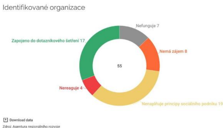
Obrázek 1 – Počet organizací zapojených do mapování sociálních podniků

Jako podklad pro veškeré aktivity projektu slouží výstup z počátečního mapování sociálních podniků, které probíhalo ve spolupráci s projektem Smart Akcelerátor Libereckého kraje v průběhu roku 2024. V první fázi bylo vytipováno celkem 55 subjektů sociální ekonomiky v Libereckém kraji, z nichž se nakonec se zájmem do mapování zapojilo pouze 17 .