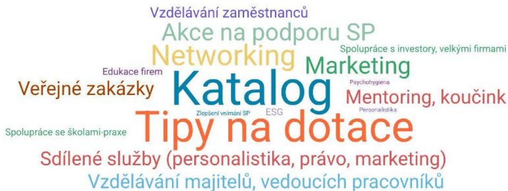
Obrázek 4 - Vítaná podpora pro subjekty sociální ekonomiky

Jaká podpora má pro sociální podniky největší přínos